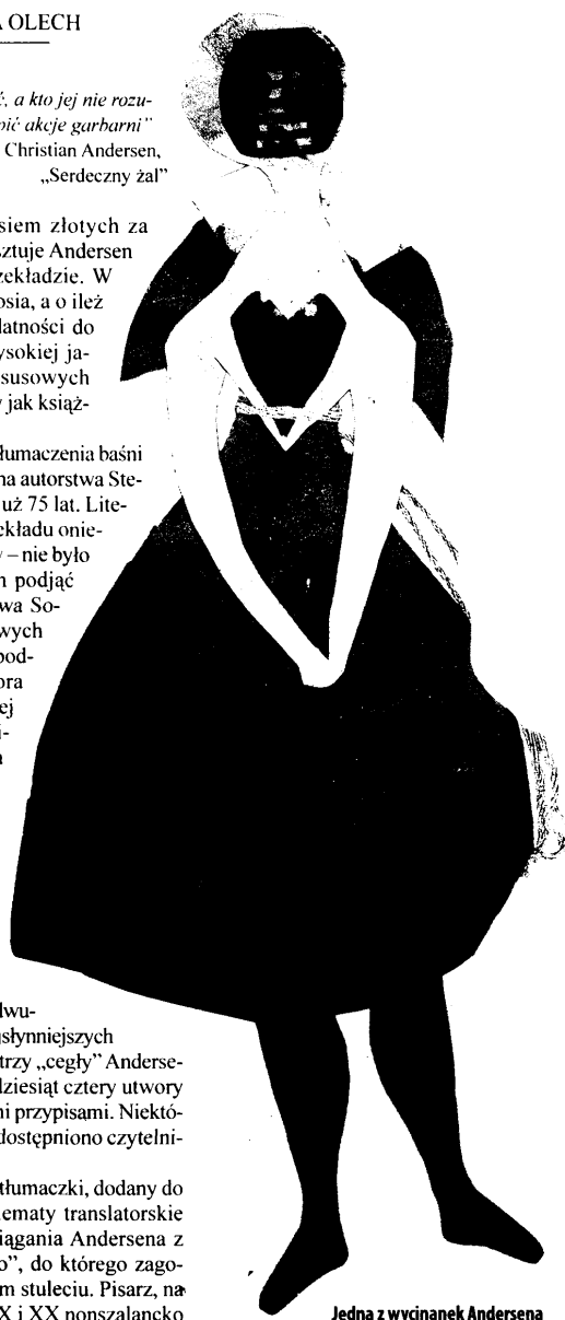
Jedna z wycinanek Andersena

Nowy przekład dostarcza nam materiałów do porównań, a co za tym idzie –