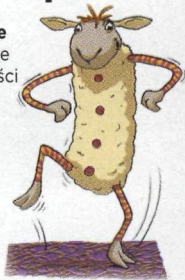
Tupanie - dodaje pewności siebie