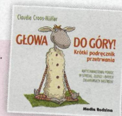
„Głowa do góry”, wyd. Media Rodzina, 19,90 zł.