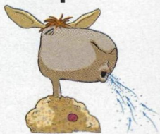
Wciąganie powietrza - uspokaja nerwy, przegania przygnębienie