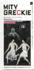
Nathaniel Hawthorne seria „Mity greckie”, wyd. Akademia Rozwoju Wyobraźni BUKA. Seria książek i audiobooków. Cena 31 zł