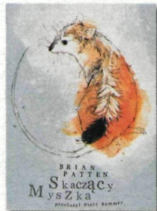
Brian Patten „Skaczący Myszka”, przetł. Piotr Sommer, wyd. Biuro Literackie. Opowieść oparta na indiańskiej legendzie. Cena 23 zł